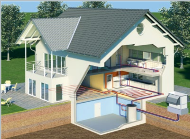
Aussenaufstellung einer ELCO AEROTOP® T Wärmepumpe

ELCO AEROTOP® T Wärmepumpen arbeiten effizient: Durch den Einsatz von 1 kWh elektrischer Energie werden im Durchschnitt mehr als 3 kWh Heizenergie erzeugt. Dieser hohe Wirkungsgrad wird insbesondere in Kombination mit Niedertemperatur- oder Fussbodenheizungen erreicht. Und auch optisch machen ELCO AEROTOP® T Wärmepumpen einen starken Eindruck. Das ansprechende Design unterstreicht das solide und zeitlose Erscheinungsbild.